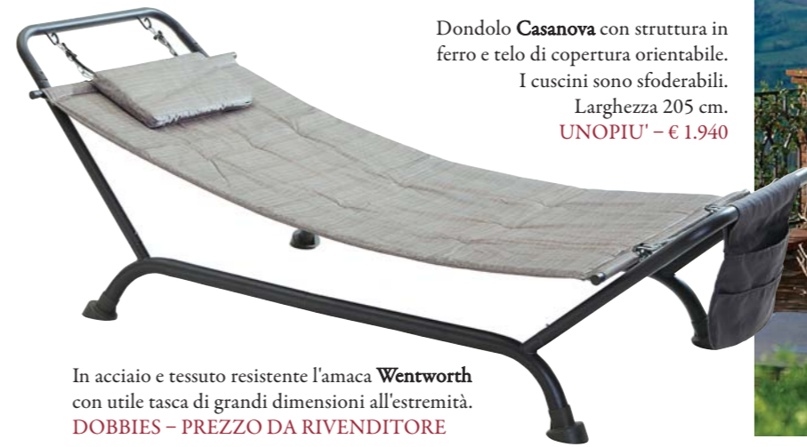
In acciaio e tessuto resistente l'amaca Wentworth con utile tasca di grandi dimensioni all'estremità. DOBBIES - PREZZO DA RIVENDITORE