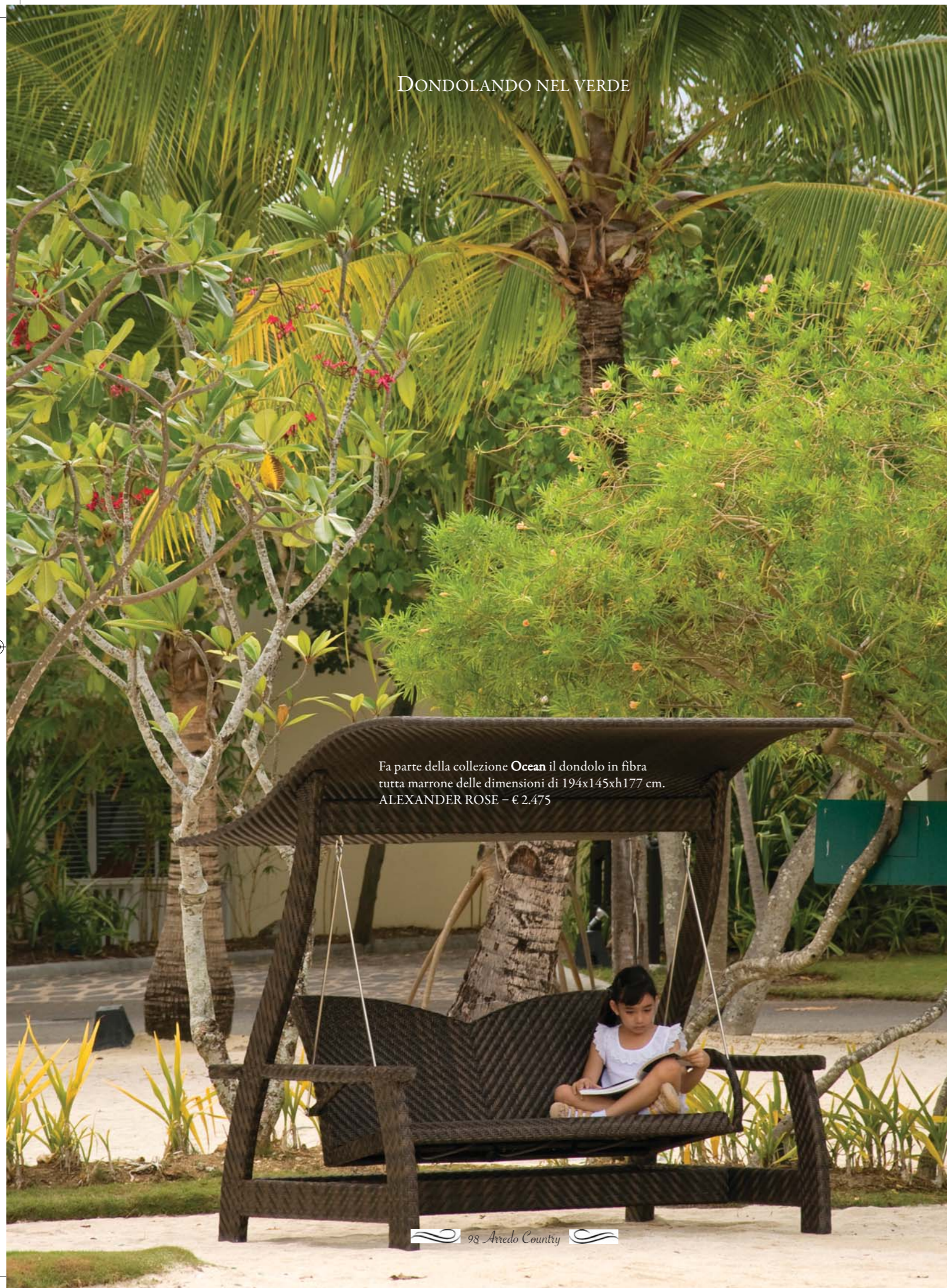
Fa parte della collezione Ocean il dondolo in fibra tutta marrone delle dimensioni di 194x145xh177 cm. ALEXANDER ROSE - € 2.475