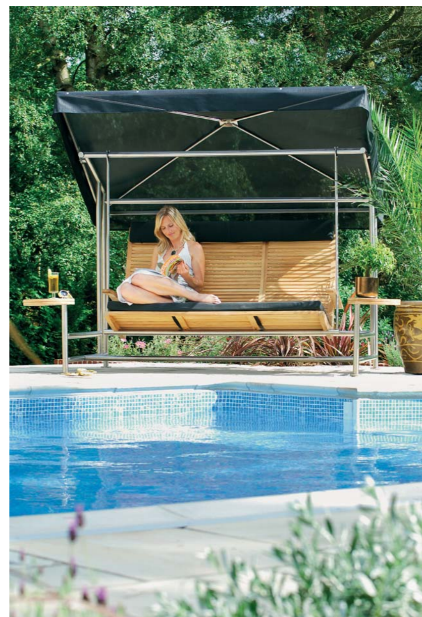
Teak e acciaio inossidabile per il dondolo della collezione Avant con telo di protezione scuro. Dimensioni: 263x158xh184 cm ALEXANDER ROSE - € 3.999