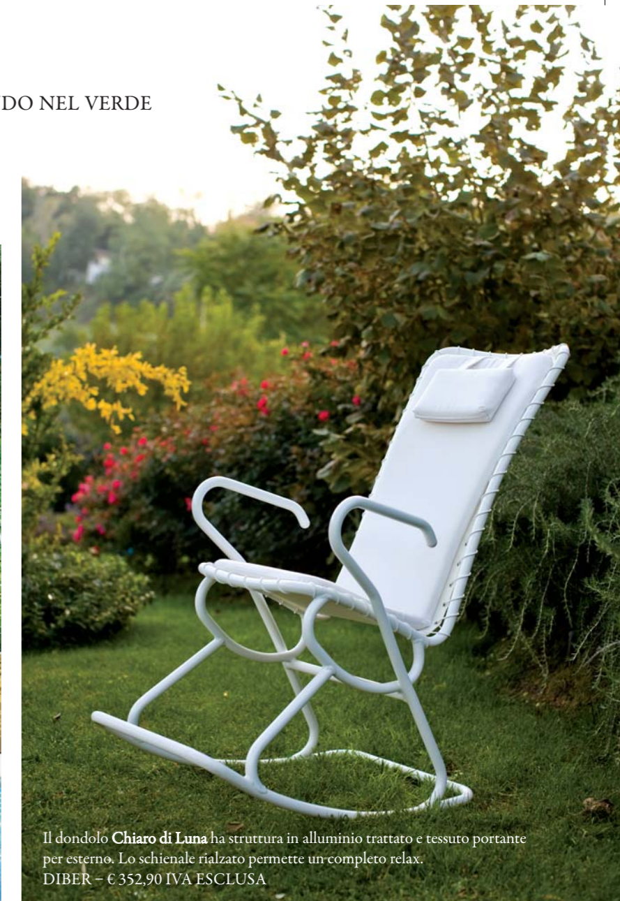
Il dondolo Chiaro di Luna ha struttura in alluminio trattato e tessuto portante per esterno. Lo schienale rialzato permette un completo relax. DIBER - € 352,90 IVA ESCLUSA